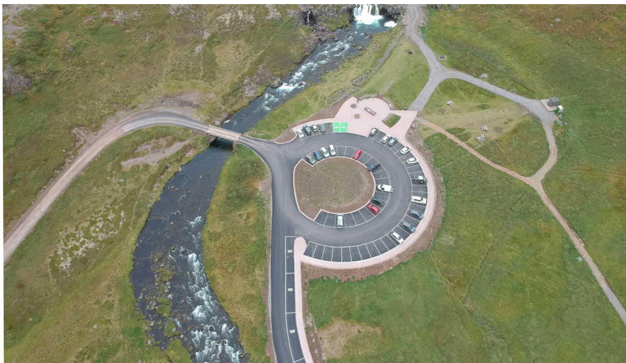
Mynd 6. Afrakstur að verki loknu.