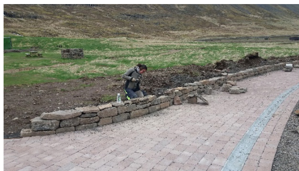
Mynd 5. Nútíma hellulögn og forn hleðsla sameinuð.