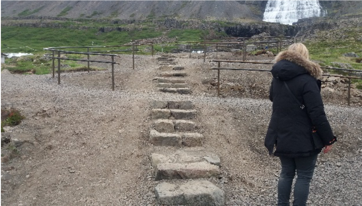
Mynd 4. Göngustígur eftir aðgerðir. Tröppur úr náttúrugjóti og skábraut með handlistum.