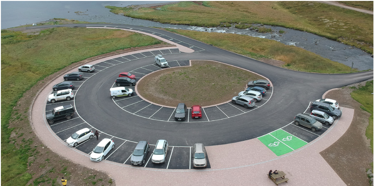
Mynd 1. Nýtt og stækkað bílastæði við Dynjanda að framkvæmd lokinni.