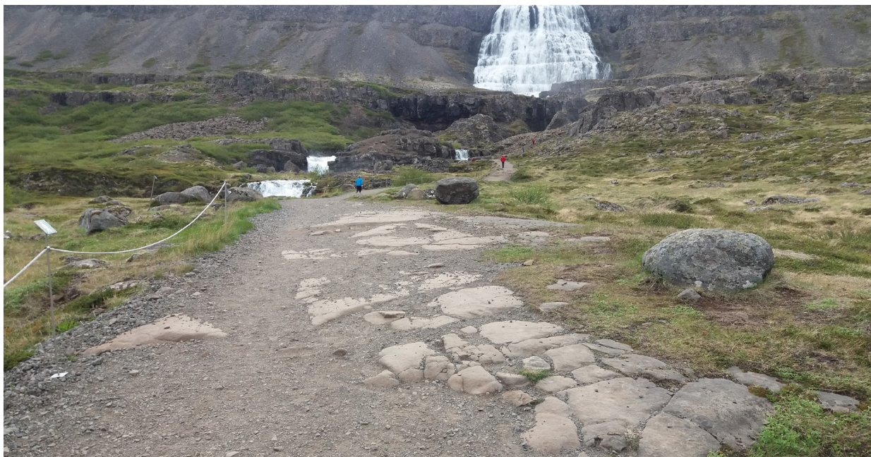
Mynd 2. Göngustígur fyrir aðgerðir.