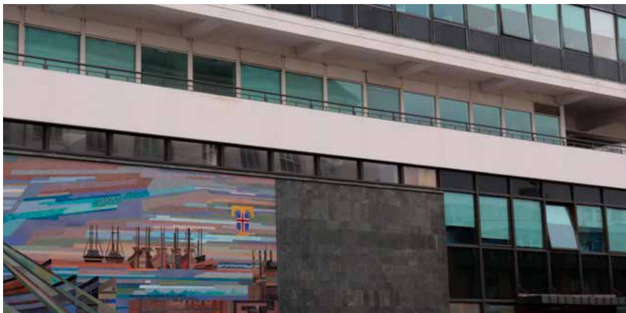
Mynd 1. Tollhúsið Tryggvagötu 19.