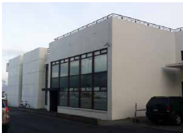
Mynd 4. Vesturhlíð Tollhúss og Geirsbrúar.