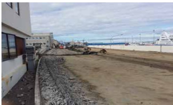
Mynd 9. Efni fjarlægt af Geirsbrú.

Í júlí var komið upp aðstöðu á þaki Tollhússins, verkpallar voru settir upp á austurhlíð, aðgengi starfsmanna gert upp á þak og komið fyrir rennu til að taka niður efni af þaki, malbiki og mól. Steypuviðgerðum var framhaldið og að mestu lokið við að fjarlægja malbik, mól og biksteypu af þaki Geirsbrúar og Tollhússins.