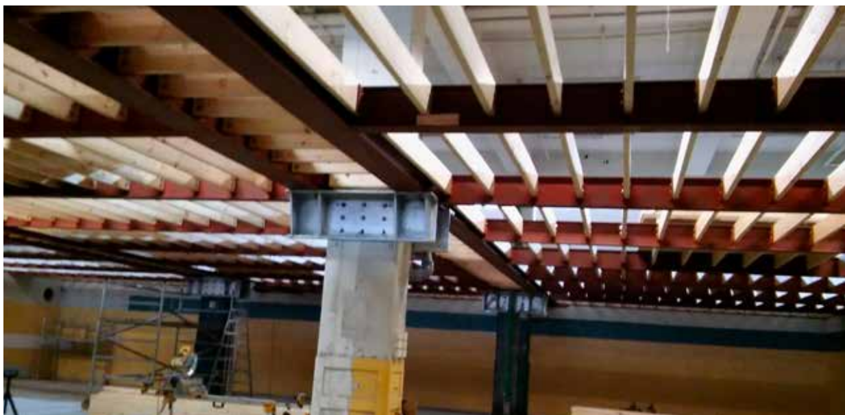
Mynd 7. Unnið að fyllingu að netgrindum.