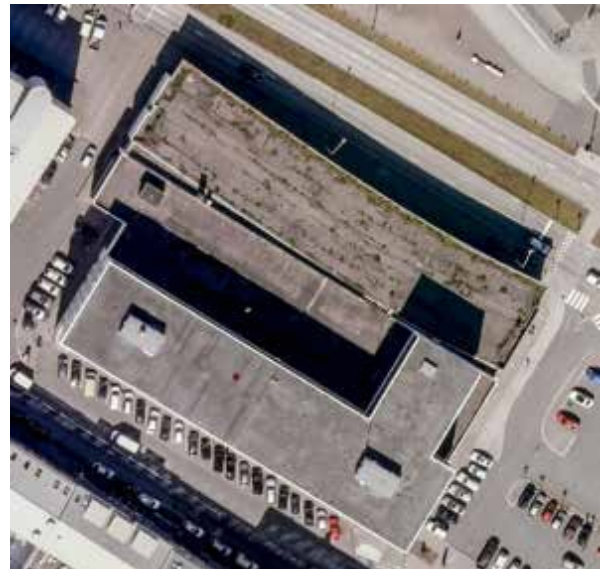
Mynd 6. Tollhúsið og Geirsbrú séð ofan á þak fyrir breytingu.

Ríkiseignir fjármagna verkið með leigutekjum af húsnæðinu sem um ræðir.