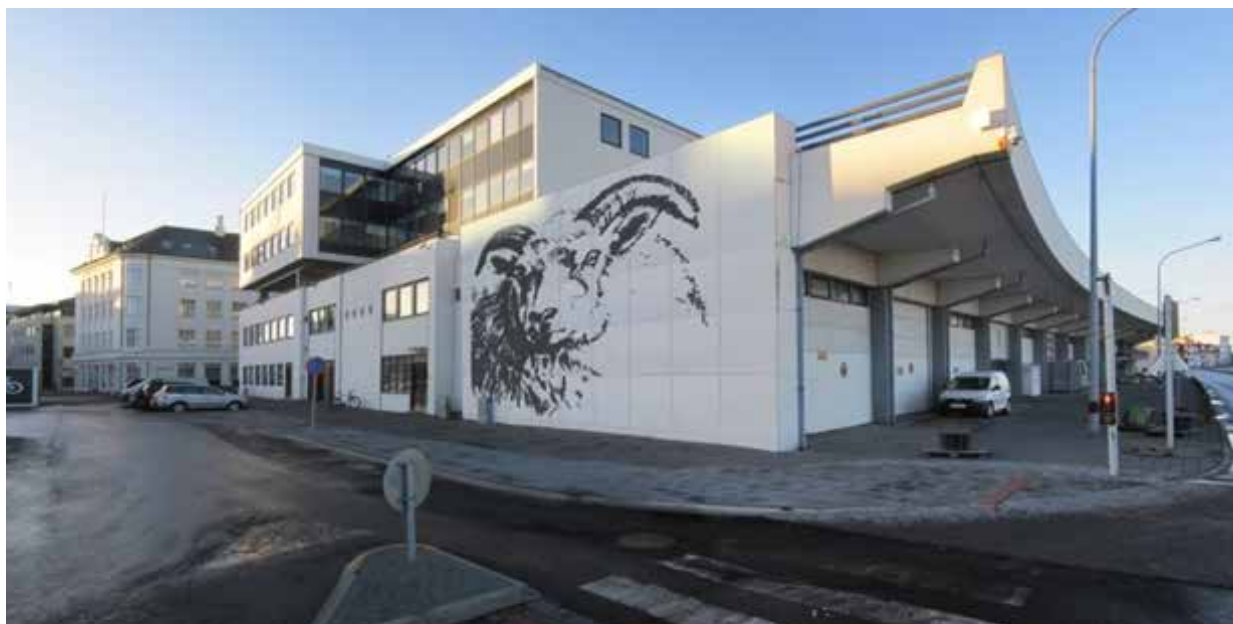
Mynd 2. Austur- og norðurhlíð Tollhúss og Geirsbrúar.