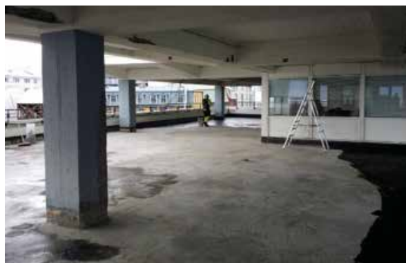
Mynd 10. Þak á Tollhúsi undirbúið.

Í ágúst var lokið við að fjarlægja biksteypu af þaki og allri hreinsun lauk. Steypuviðgerðir hófust á þaki og veggöflum. Hlaðinn veggur var rifinn og veggur steypur á milli Tollhúss og rennu. Dúklögn hófst á undirlagi þakklæðningar. Málning á austurgafli hófst en var lokið á norðurhlíð.