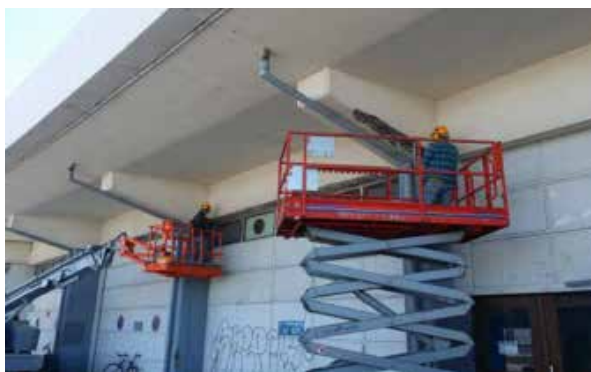
Mynd 8. Viðgerðir á norðurhlíð Tollhússins (inngangur í Kolaportíð).

Verkið hófst formlega þann 22. maí 2015. Aftur á móti gekk nokkuð erfiðlega að komast af stað þar sem þó nokkrar tafir urðu á útgáfu framkvæmdarleyfis. Undirbúningur aðstöðusköpunar og skipulag á niðurtekt á niðurrifi af þaki hófst í verkbyrjun og steypuviðgerðir á norðurhlíð í júníbyrjun. Framkvæmdarleyfið var gefið út þann 29. júní 2015. Þá var að mestu lokið við steypuviðgerðir á norðurhlíð.