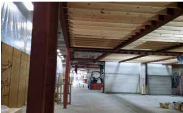
Mynd 12. Stálvirki og burðarvirki komið upp innanhúss.

Í marsbyrjun 2016 var smíði og uppsetning á stálvirki hafin og bráðabirgðaveggur kominn upp. Búið var að fjarlægja loftræsilagnir og pípulagnir og breyta legu lagna þar sem þess var þörf. Dúklögn á Geirsbrú var ólokið auk áfella við brúnir. Þrýstijöfnunartúður voru ófrágengnar á þaki Tollhúss og Geirsbrúar. Frágangi á handriðum var ólokið.