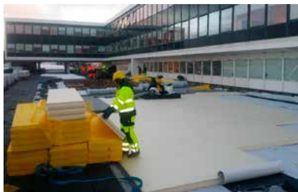
Mynd 11. Einangrun á þaki Tollhússins.

Í október lauk öllum steypuviðgerðum. Dúklögn á Geirsbrú stóð enn yfir. Einangrun og hellulögn á Tollhúsi var ekki hafin. Málun glugga á öllum hlíðum stóð yfir og málun norðurgafis á 4. og 5. hæð Tollhússins. Frágangur handriða var kominn vel á veg.