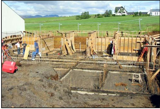
Uppsáttur kominn vel á veg.