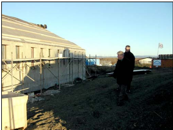
Unnið við múrhúðun