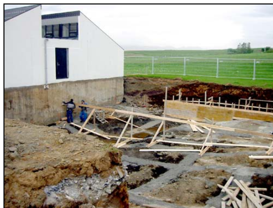
Uppsláttur neðri hæðar hafinn.

Samkvæmt verkáætlun átti verkinu að ljúka 15. desember 2002. Fallist var á kröfu verktaka um lögmætar tafir um 19 virka daga, sem stöfuðu aðallega af ófyrirséðri magnaukningu á uppgreiftri. Lokadagur verksins var 15. janúar 2003.