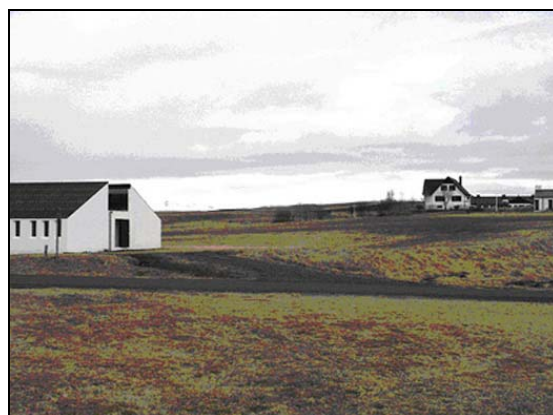
Byggingarstæðið við austurgaf skólans.

Allar fjárhæðir í töflunni eru með vsk., en í reikningslegu uppgjöri í kafla 3 eru þær án vsk.