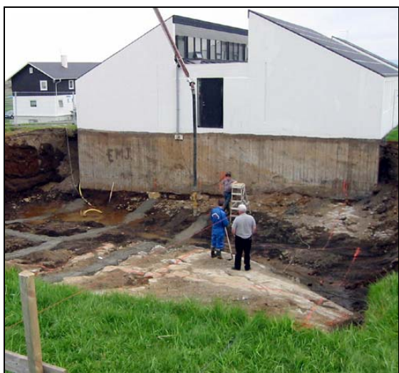
Grunnur að verða tilbúinn fyrir uppslátt.

Samkvæmt ákvörðun Kirkjuráðs á fundi 6. mars 2001 var fjárveiting til verksins um kr. 30 milljónir. Við nánari skoðun var þó ljóst að heildarframkvæmdarkostnaður yrði mun hærri og var fyrsta áætlun FSR um kr. 56 milljónir, sem kynnt var verkkaupa og hún samþykkt.