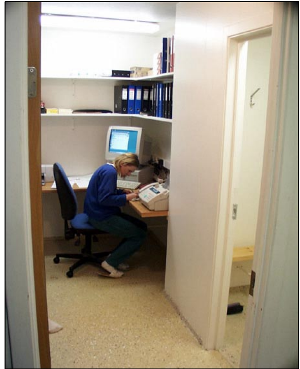
Öll aðstaða batnaði verulega með tilkomu nýja hússins

Í köflum 1 og 2 er rakin framvinda verksins við frumathugun og áætlunargerð. Einnig er sagt frá fjármögnun og samþykki Samstarfsnefndar um opinberar framkvæmdir fyrir framkvæmdunum. Framkvæmdir hófust um miðjan júní 2000 og lauk þeim í nóvember 2000. Úttekt fór fram 4. desember 2000 og var verkkaupa þá afhent húsnæðið til afnota. Tafir sem urðu á því að verkinu væri skilað, en því átti að skila 31. október 2000, má rekja til óska verkkaupa um viðbætur og afleiðingar þeirra, þ.e. tafa vegna vinnslu á endanlegri áferð veggja í klefum.