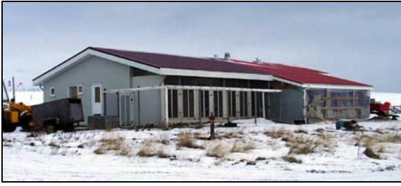
Einangrunarstöð gæludýra í Hrísey

Verkið náði til þess að stækka einangrunarstöð gæludýra og breyta jafnframt eldri byggingunni lítillega.