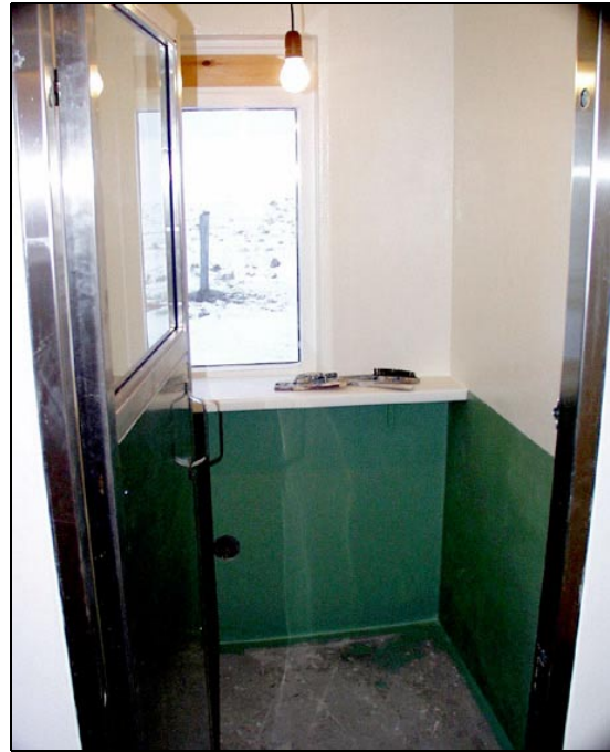
Eitt herbergja hússins