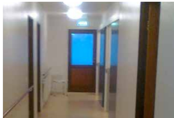
Mynd 3. Nýr dúkur á gólfum.

Vegna skorts á fjármagni var ekki unnt að hrinda í framkvæmd öllum þeim brýnu lagfæringum og endurnýjun sem óskað hafði verið eftir. Brýnt var að gera úttekt á nauðsynlegu viðhaldi hússins og hrinda í framkvæmd eftir forgangsröð.