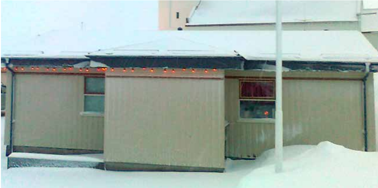
Mynd 1. Sambýlið Lindargötu 2, Siglufirði.