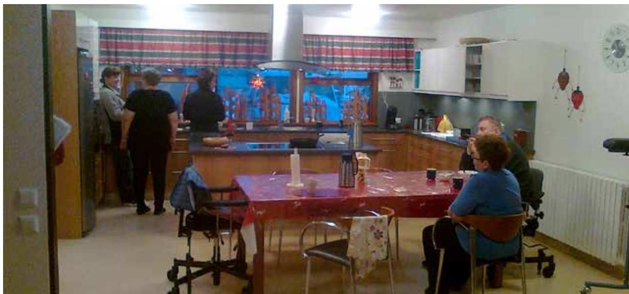
Mynd 4. Eftir breytingu.