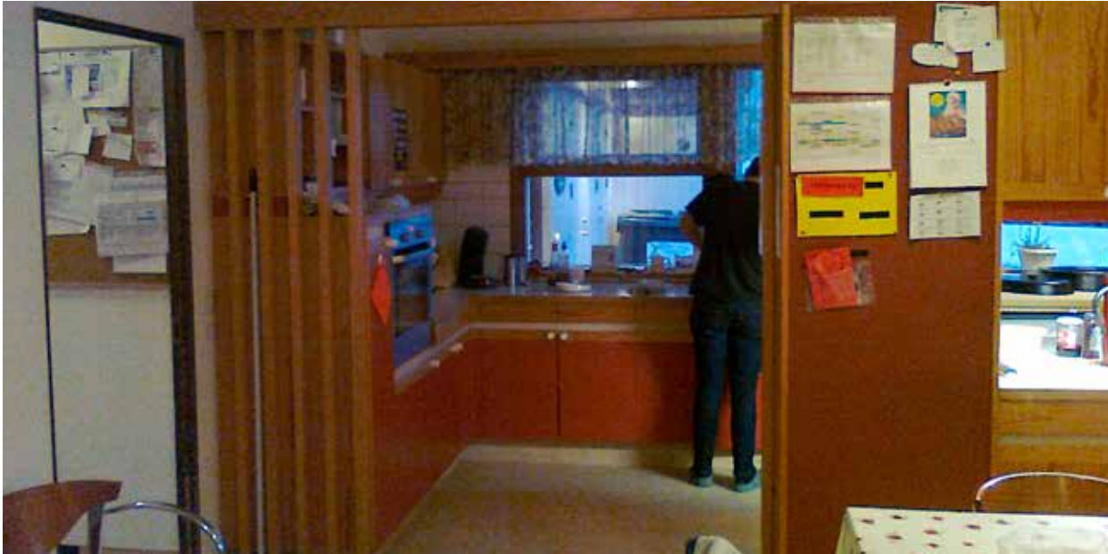
Mynd 2. Fyrir breytingu.