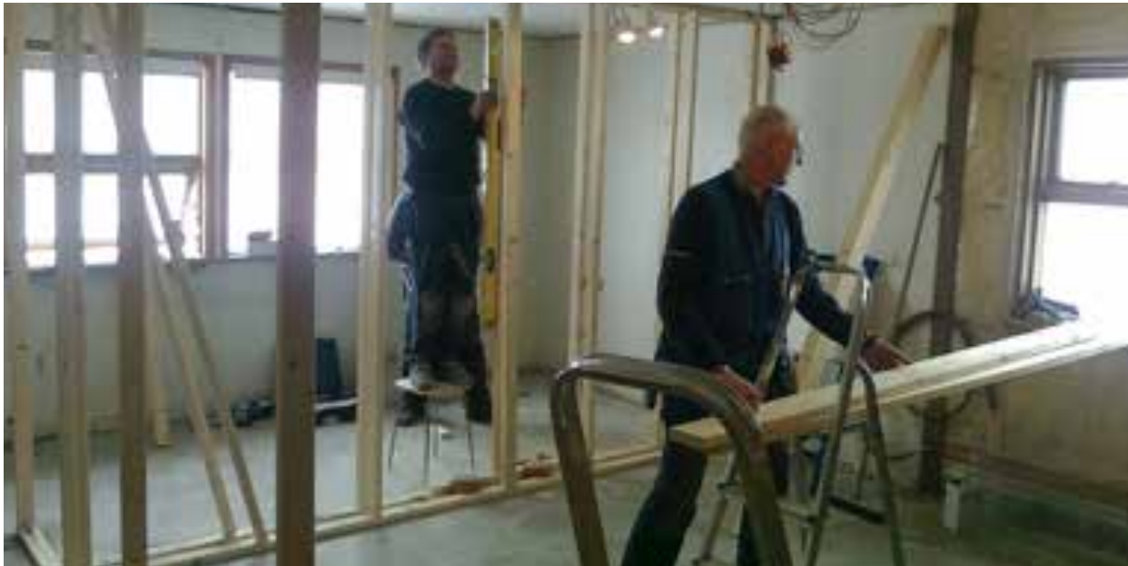
Mynd 2. Á byggingartímanum.