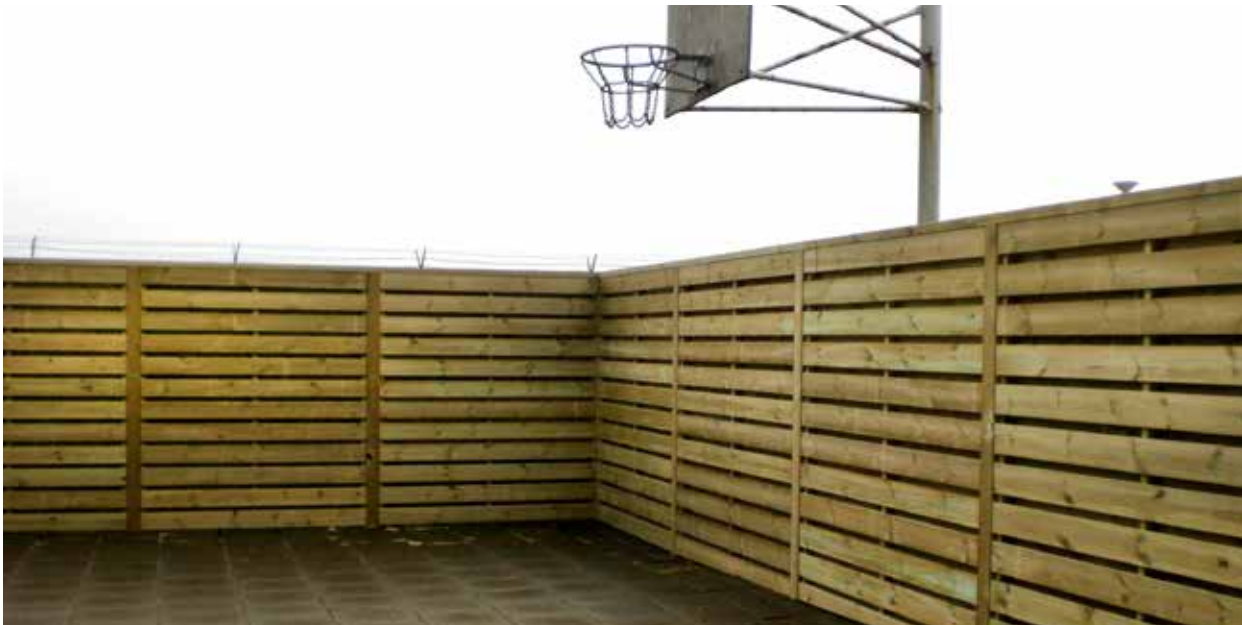
Mynd 3. Skjólveggur á lóð.