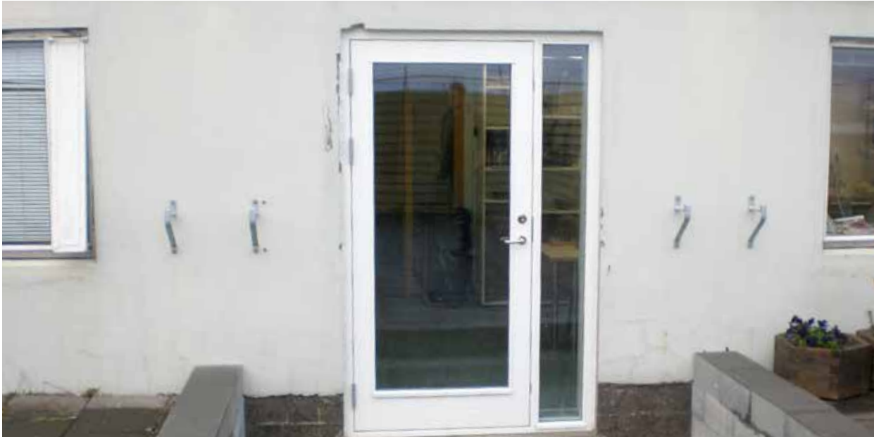
Mynd 2. Ný útihurð að lóð.