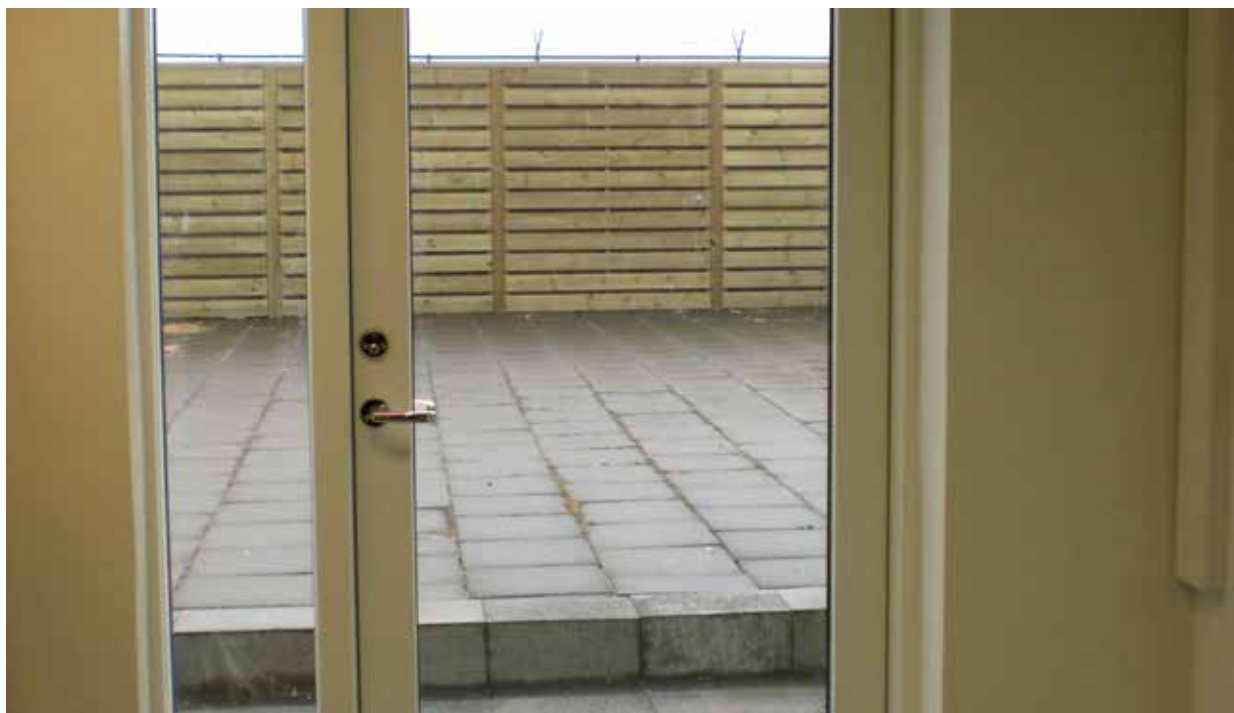
Mynd 4. Ný útihurð að lóð séð innan frá.