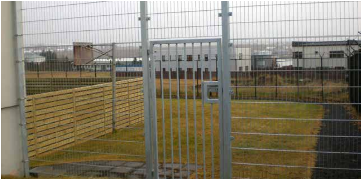
Mynd 1. Öryggisgirðing á lóð.