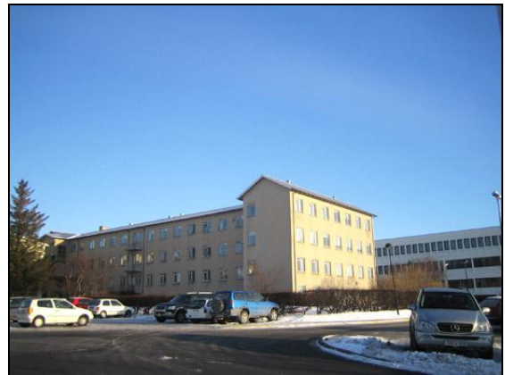
Hjúkrunarskólinn við upphaf framkvæmda 2008.