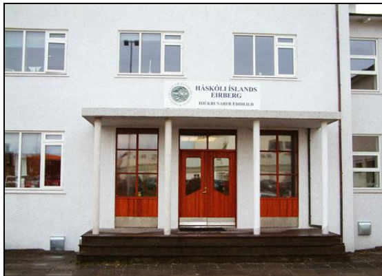
Aðalinngangur eftir viðgerðir.

Gluggaskipti voru unnin í nánun samstarfi við notendur í húsinu og gerðar voru vikulegar áætlanir um gluggaskiptin, en mikla eftirfylgni þurfti með þessum verkþætti Verkið gekk í heild skv. verkáætlun en frágangur verktaka dróst þó fram í október 2008.