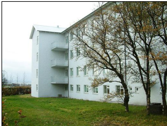
Við austanvert húsið eftir viðgerðir.