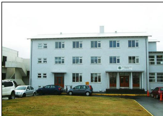
Inngangshlið hússins eftir endurbætur.