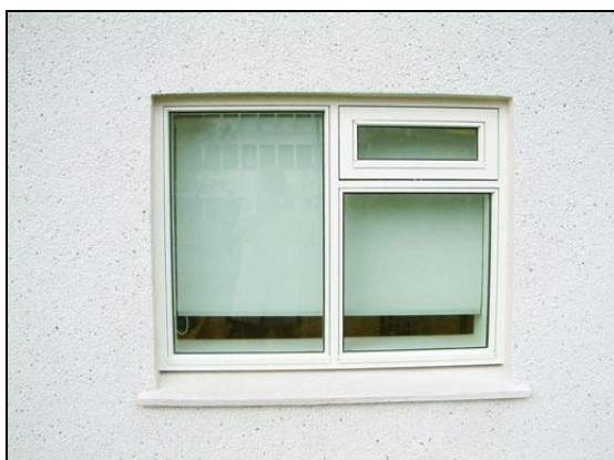
Gluggaskipti og val á gluggum þótti takast vel.