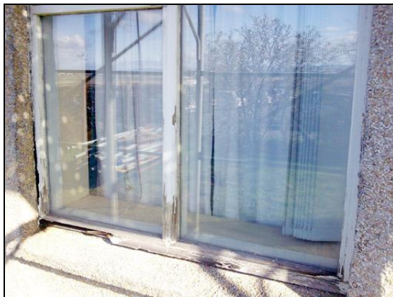
Gluggaskemmdir voru nokkuð útbreiddar.

Samið var við Múr- og málningarpjónustuna Höfn ehf. (Múr og mál ehf., samkvæmt tilboði) um verkið samkvæmt tilboði þeirra. Samningsupphæðin var 37.364.427 krónur með vsk. en án aukaverka.