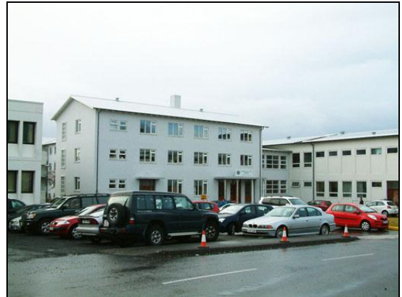
Allt annar bragur var á húsinu eftir viðgerðina.