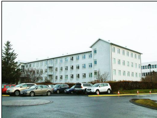
Sunnan- og vestanvert húsið eftir viðgerðir.