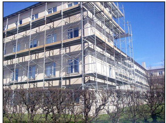
Framkvæmdir hófust með reisingu verkpalla.

Talsvert var um stórar sprungur í útveggjum og var gerður samningur við Sæljón ehf. um sprungupéttingar með ídælingu. Gerður var viðbótarsamningur við verktaka um steiningu á húsinu, auk þess sem gerður var viðbótarsamningur vegna sprungupéttinga.