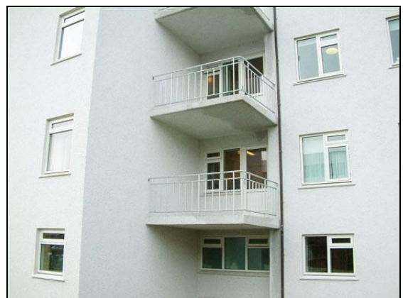
Svalir og svalahandrið voru mikið endurnýjuð.

Kostnaður eftirlits í verkinu var 4.356.749 kr. með vsk.