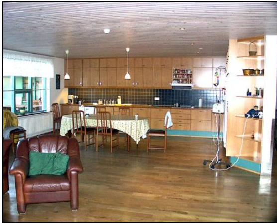
Eldhús og borðstofa