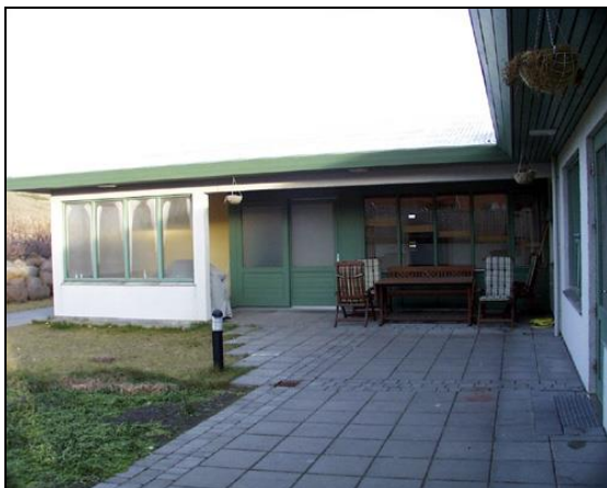
Garður. Heitur pottur vinstra megin á mynd