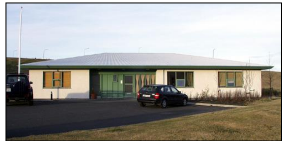
Austurhlíð - inngangur

Ekki var gerður skriflegur samningur við hönnuðina. Félagsmálaráðuneytið greiddi þá upphæð sem í töflunni stendur vegna hönnunar á árunum 1997 og 1998.