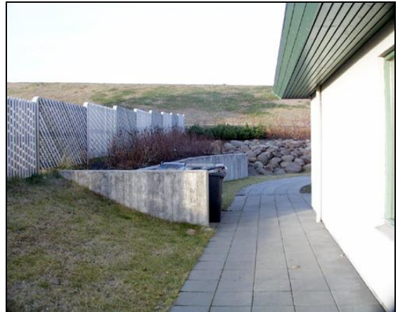
Stétt meðfram suðurhlið. Sorptumur vinstra megin