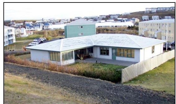
Berjahlíð 2. Horft í norðaustur