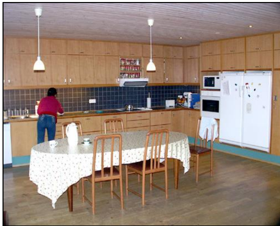
Eldhús og borðstofa