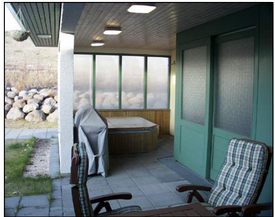
Heitur pottur fyrir miðri mynd