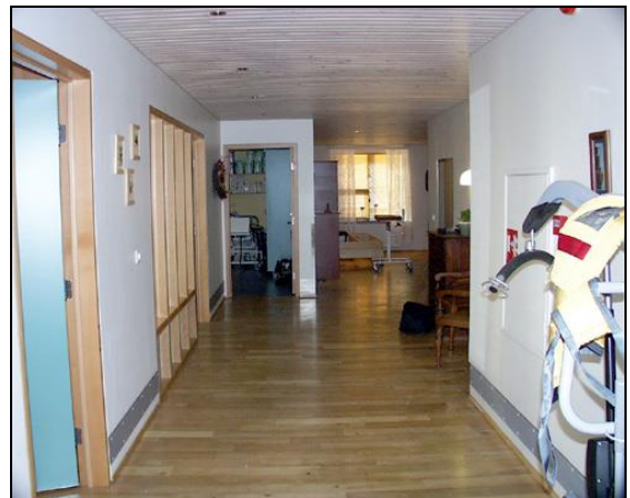
Forstofa vinstra megin. Stofa fyrir miðri mynd