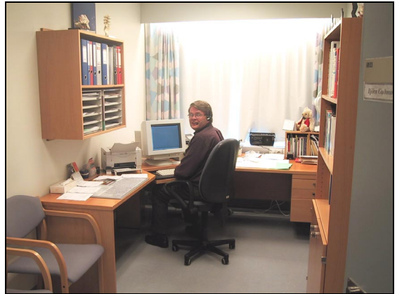
Starfsaðstaða í einni læknastofunni.

Miklar framfarir höfðu orðið hvað tölvunotkun varðar frá því hönnun hússins hófst. Af þeim sökum varð að taka frá pláss fyrir miðlæga stýringu tölvukerfis í geymslu, en ekki hafði verið ætlað pláss fyrir þann búnað í húsinu í upphaflegri hönnun.