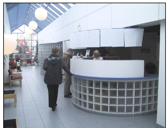
Mynd tekin í afgreiðslu í gangi. Starfsfólk hefur hengt upp pappír yfir afgreiðsluborði til hlífðar fyrir sólarálagi.

Fyrsti verkfundur með verktakanum var haldinn 10. nóvember 1997 og hóf hann þá þegar framkvæmdir.