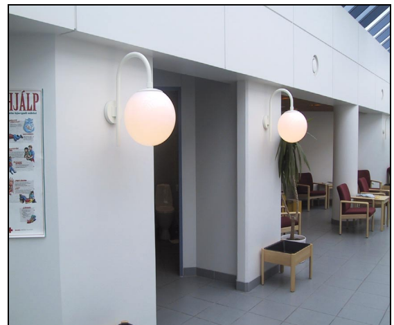
Biðstofa á gangi.

Húsið er ofnhitað og loftræst um opnanlega glugga nema innrými, sem eru loftræst vélrænt. Gólf í miðrymi er með gólfhita, þ.e. frárennsli frá ofnakerfi hússins.