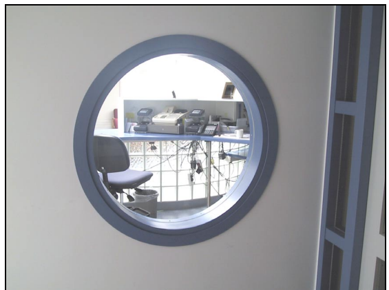
Gluggi á gangi í vesturhluta.

Þegar kom að verklokum komu fram kröfur frá rekstraraðilum um breytingar á verkinu, sem ýmist voru unnar af verktaka 2. verkáfangar