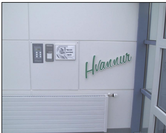
Ofn í anddyri byggingarinnar

Strax í upphafi verktímans benti verktakinn á vandkvæði við að ná fram sléttri áferð á innveggjum, þótt þeir uppfylltu skilyrði í verk lýsingu um skekkjumörk hjá fyrri verktaka. Skekkjumörkin voru 5 mm miðað við 3ja metra réttsskeið. Mála átti veggina með málningu með 20% gljáa og eykur það verulega á spéspeglun í veggjunum við ákveðin birtuskilyrði.