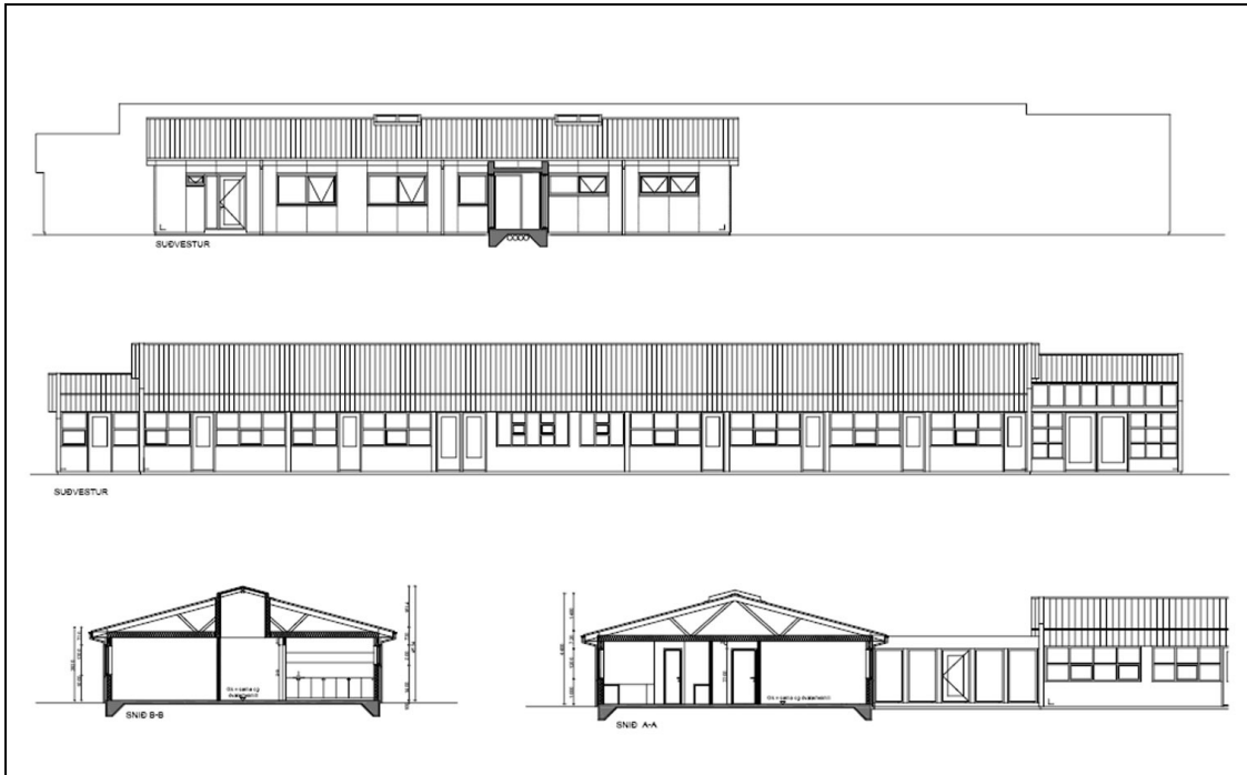
Útilit og sneiðingar.