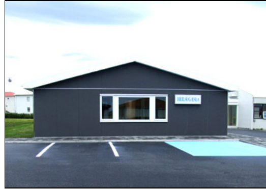
Heilsugæslustöð á Skagaströnd.