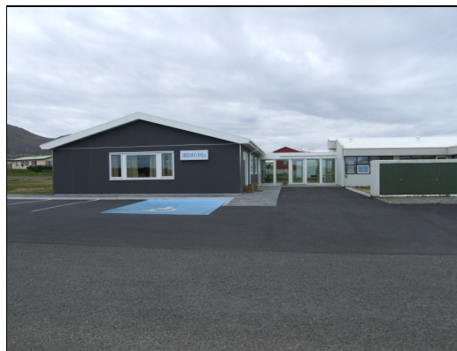
Heilsugæslustöð á Skagatrönd við verklok.

Niðurstaðan er þokkalega góður fjárhagslegur árangur.