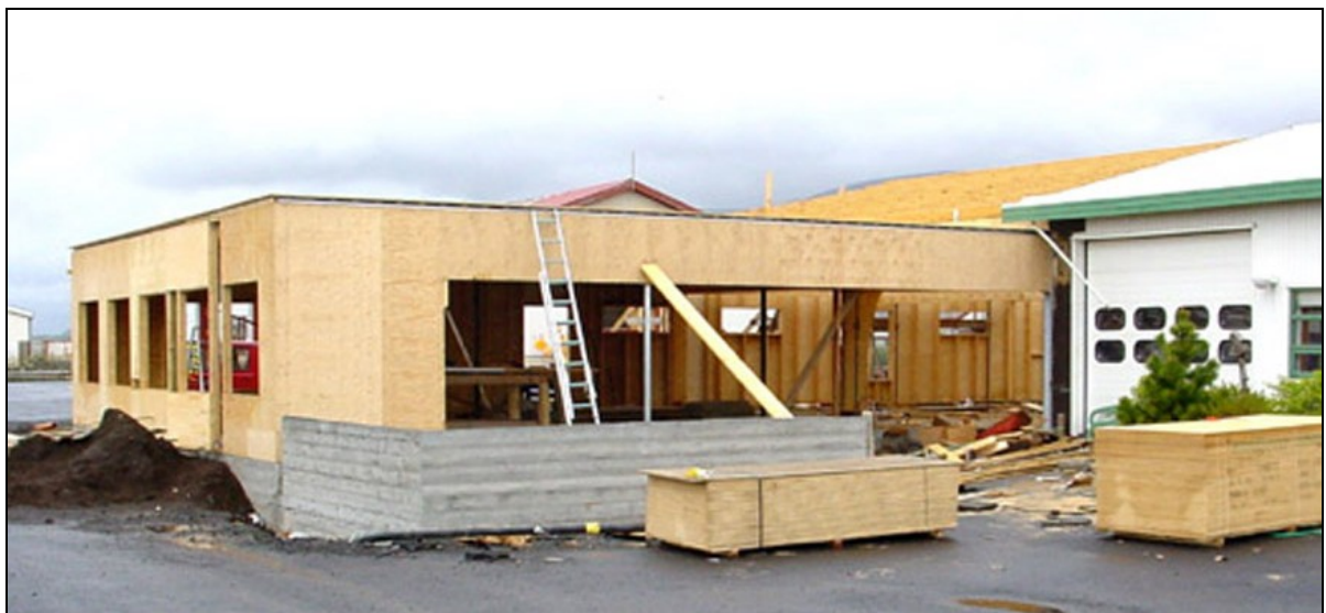
Reist viðbygging með nýjum inngangi og borðstofu.