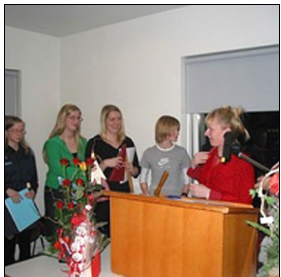
Starfsfólk við opnun hússins.