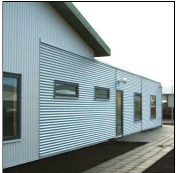
Útveggir klæddir með bárustáli.