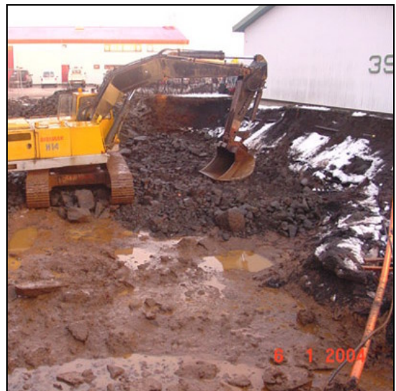
Grafið í grunni.

Framkvæmdir hófust í desember 2003. Í verkbyrjun var hafist handa við grunngröft og aðstöðusköpun. Kom fljótlega í ljós að mun dýpra var á fastan botn en reiknað var með. Má rekja stóran hluta magnaukninga til aukins grunngrafter fyrir húsi og fyllinga í grunn. Lokið við fyllingar í lok febrúar 2004 og var grunni haldið þurrum með dælingu en ekki var reiknað með því. Samtals námu magnaukningar í grunni 1.075 m 3 í grunngræftri og 1.254 m 3 í fyllingum undir sökkla og heildarkostnaður nam um 2,6 m.kr. eða 5,8% af tilboðsfjárhæð.