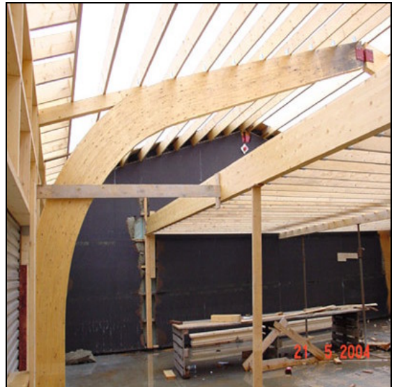
Stækkun á vinnusal með límtré eins og eldri hluti.