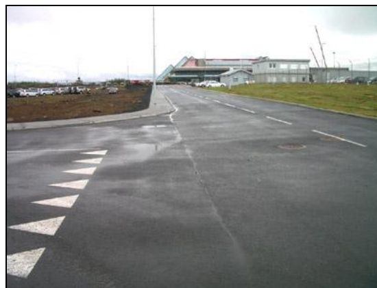
Kjávöllur (við Blikavöll) til vesturs.