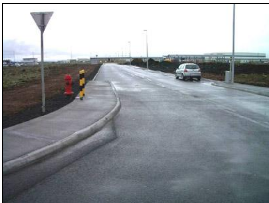
Blikavöllur (við Kríuvöll) til suðurs,

Helstu þættir viðbótarverka voru gröftur 700 rúmmetrar, fylling 1.100 rúmmetrar og mal-bikun 970 fermetrar.