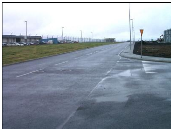
Arnarvöllur (við Kjóavöll) til norðurs.