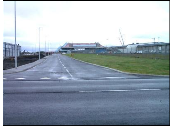
Kjóavöllur (við Arnarvöll) til vesturs, í átt að FLE.

Fjárhagslegur árangur í heild telst góður.