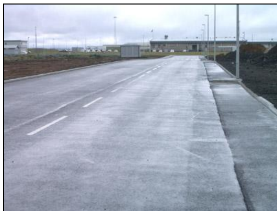
Blikavöllur til suðurs, í átt að flugeldhúsi.