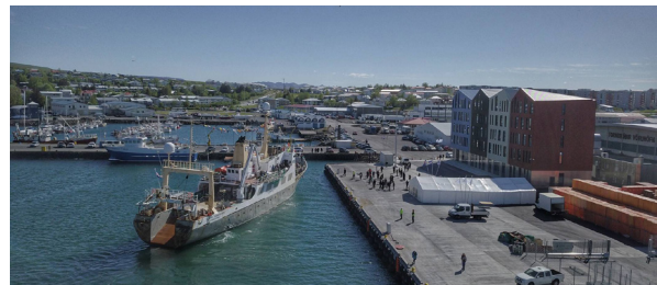
Mynd 2. Nýjar höfuðstöðvar Hafró í Hafnarfirði.

Ef Hafró hefði ekki geta verið í þessu millibilsástandi í eldra húsnæðinu við Skúlagötu, hefði það getað haft afar slæmar og kostnaðarsamar afleiðingar fyrir stofnunina.