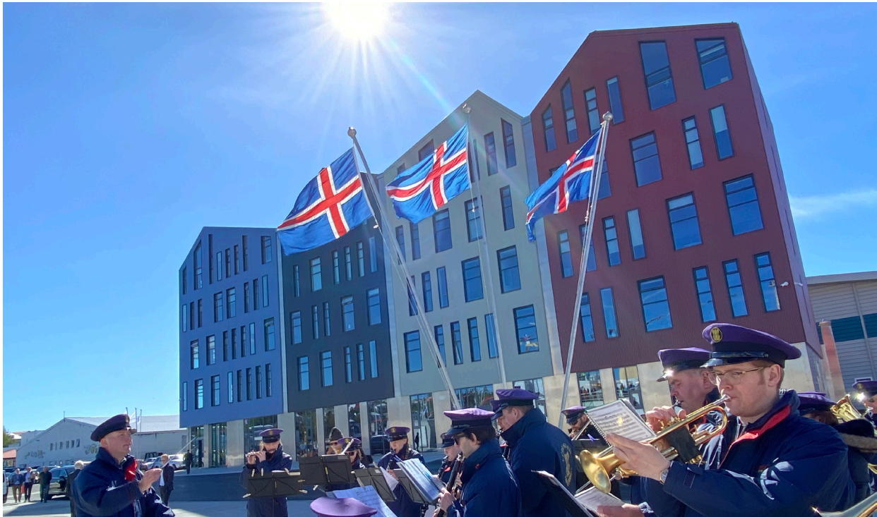
Mynd 1. Höfuðstöðvar Hafrannsóknarstofnunnar í Hafnarfirði